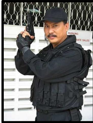
Gambar 1: Tokoh, Zulkifli Ismail sebagai ASP Razlan dalam drama bersiri Gerak Khas